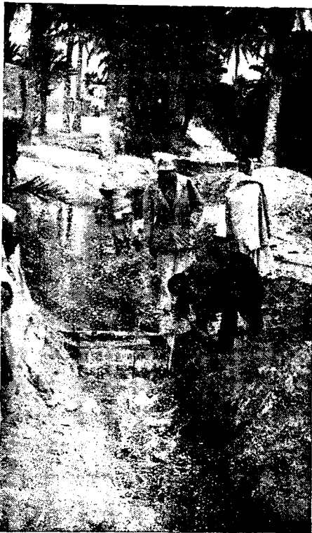
3. — Ouverture à 96 cm. 5 du déversoir placé à l'amont de la séguia de Fatnassa

Les opérations ont été conduites avec le plus grand soin par :