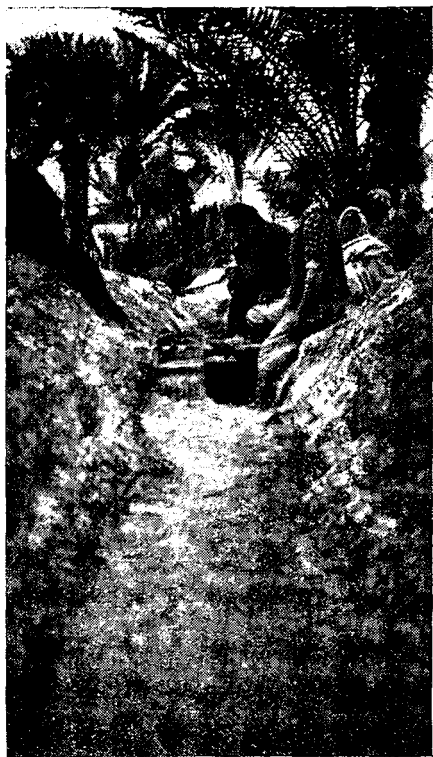
4. — Ouverture à 54 cm. du déversoir placé à l'aval à l'entrée dans l'Oasis de Fatnassa

Les résultats obtenus figurent au tableau des pages 46 et 47.