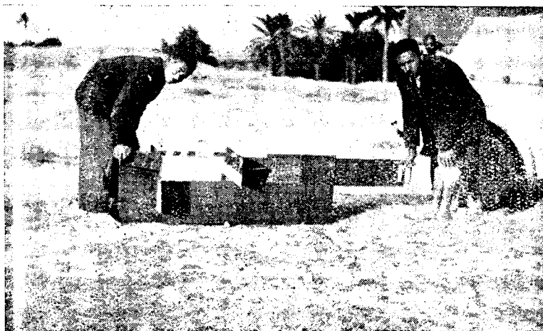
1. — Vue d'aval du déversoir

ces mesures ont été faites à l'aide de deux déversoirs de largeur variable avec lames d'eau de hauteur constante (voir photo n° 1).