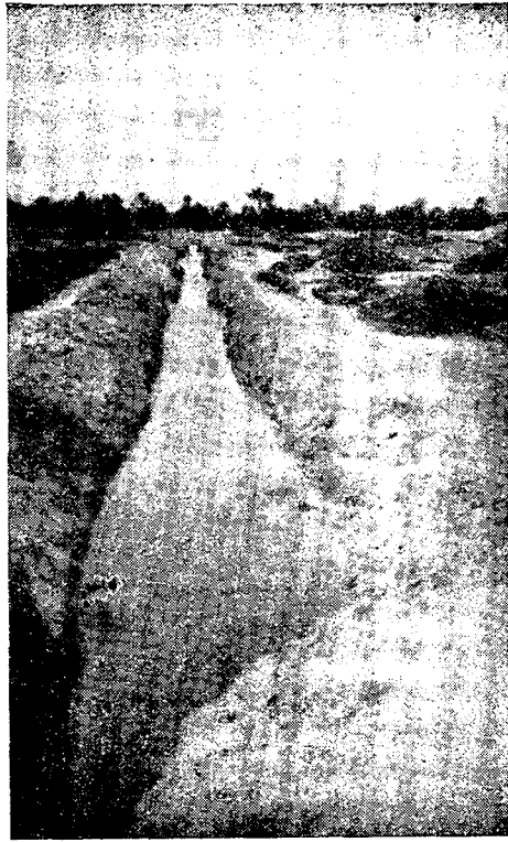
5. — La différence d'écartement des parois latérales des deux déversoirs fait apparaître clairement la perte de la séguia qui est de 44 % sur un parcours de 650 mètres