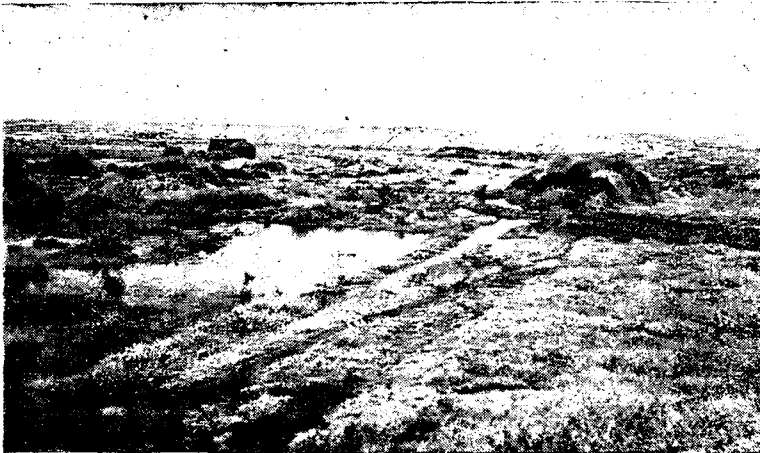
6. - Les débordements et les infiltrations des séguias en terre apparaissant sur la photo ci-dessus ne tarderont pas à élever le niveau de la nappe souterraine qui mettra en péril les cultures entreprises à la surface du sol