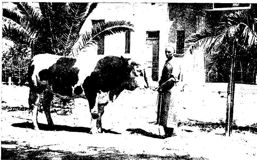
« Luron »

Il est désirable qu'à ces géniteurs puissent être adjoints le plus rapidement possible des taureaux Bruns de l'Atlas et des Scindh.