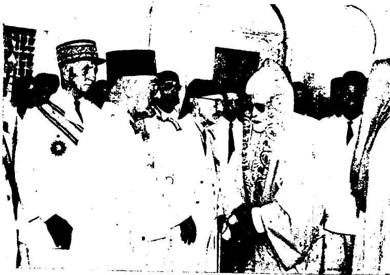
S. A. le Bey reçoit les condoléances des personnalités françaises et tunisiennes à l'occasion du décès de sa sœur, la Princesse Fatma.