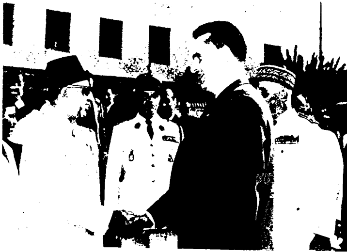
M. Fouchet arrive au Dar El Bey pour l'ouverture solennelle de la négociation. Il y est reçu par S. E. Tahar Ben Ammar, Président du Conseil, entouré des Ministres.