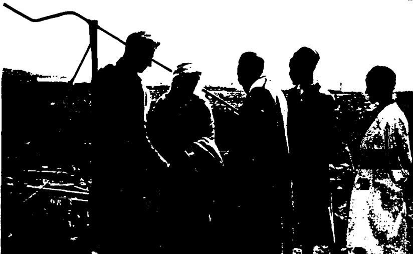
Palabres à Souk-el-Arba en 1949

Le tracteur ci-dessus, le premier dont fut doté le Groupement de Défrichement de la Regba (Contrôle Civil de Souk-el-Arba), est aujourd'hui entouré de toute une gamme de matériel moderne.