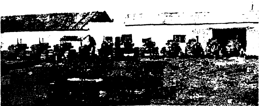
En 1954, les tracteurs du groupement de motoculture de Pont-du-Fahs créé en 1950 avec trois tracteurs. Au début de 1955, 36 groupements S.T.P. de Motoculture groupent 176 tracteurs d'une puissance totale de 7.576 CV.

L'idée n'en faisait pas moins petit à petit son chemin. C'est encore à Souk-el-Arba, dont les contrôleurs successifs méritent un hommage particulier pour leur compréhension et leur concours actif, qu'étaient trouvées les raisons d'espérer : après avoir fonctionné pendant la campagne 1947 avec du matériel prêté par les colons, après avoir eu recours ensuite aux tracteurs Clétrac, toujours les mêmes, retirés de Tadjerouine, le groupement de Ben-Bachir, constitué et animé par une éminente personnalité tunisienne, put prendre son essor avec son matériel propre, grâce en partie à l'aide du Paysannat. D'autres